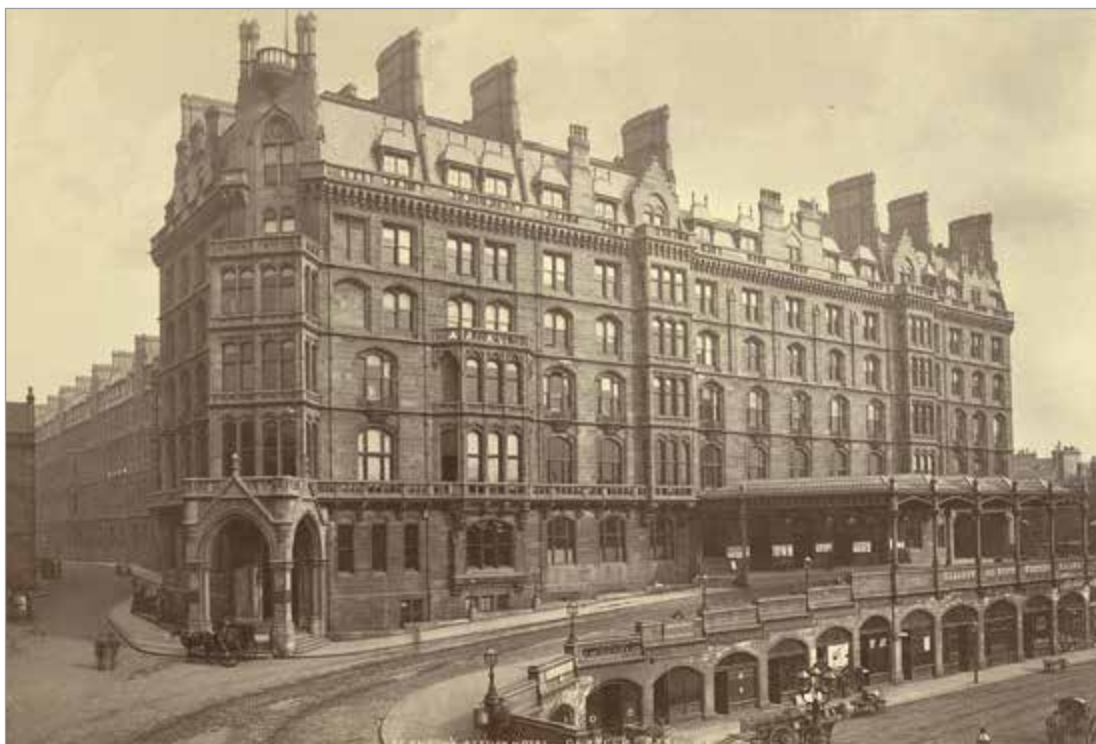
Una veduta d'altri tempi del St. Enoch Station Hotel di Glasgow