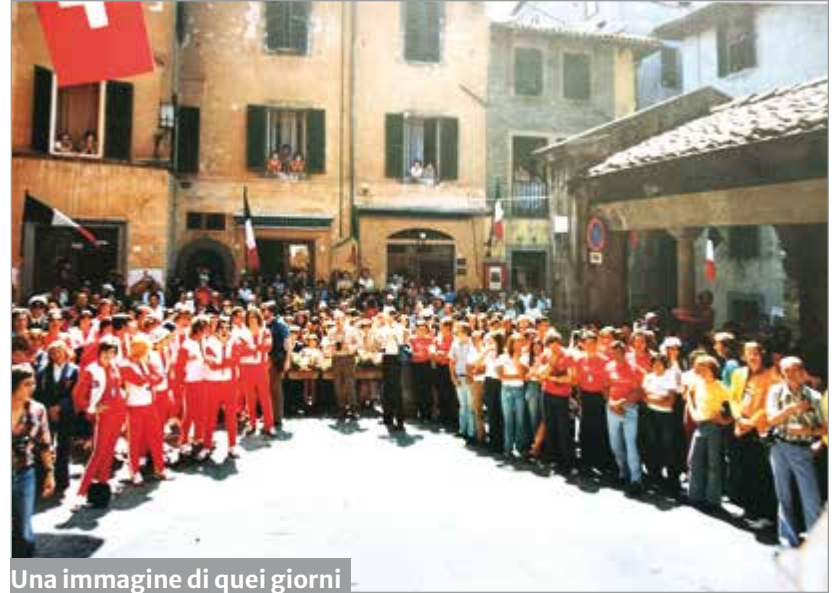
Una immagine di quei giorni

BARGA - Il 29 giugno nella saletta di Palazzo Balduini in piazza Garibaldi è stata inaugurata la mostra celebrativa per i cinquant'anni dalla partecipazione di Barga, grazie al Ciocco, ai "Giochi senza frontiere". La mostra si intitola "Giochi senza frontiere. 1974-2024" e vi sono esposte fotografie dell'epoca, cimeli ed altro materiale.